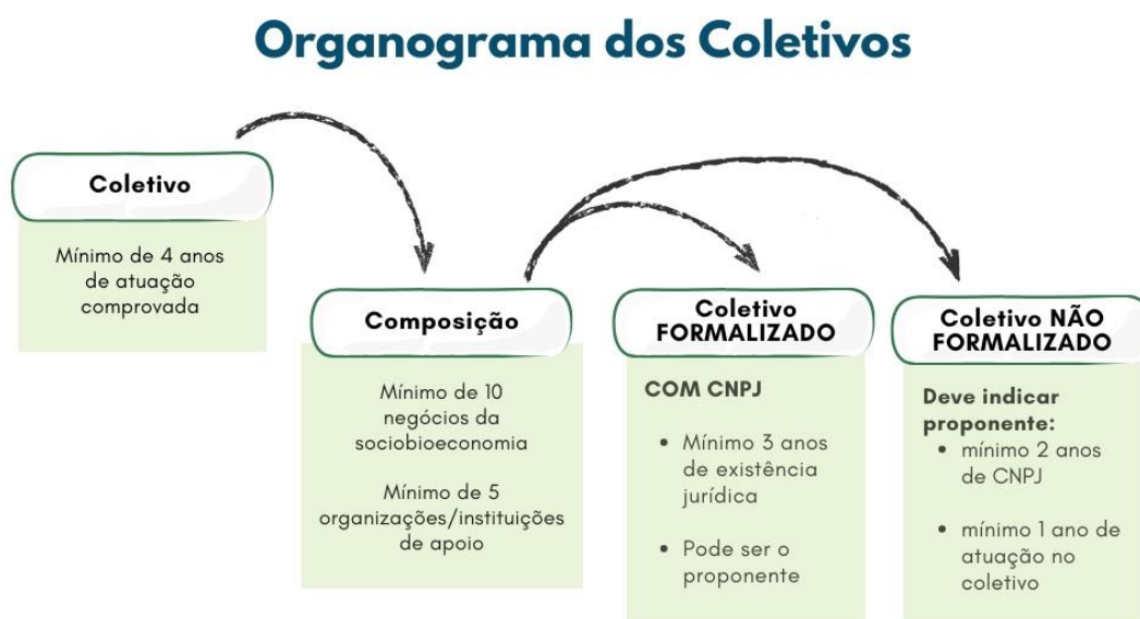
Figura 1. Tipos de coletivos e formas de participação no edital