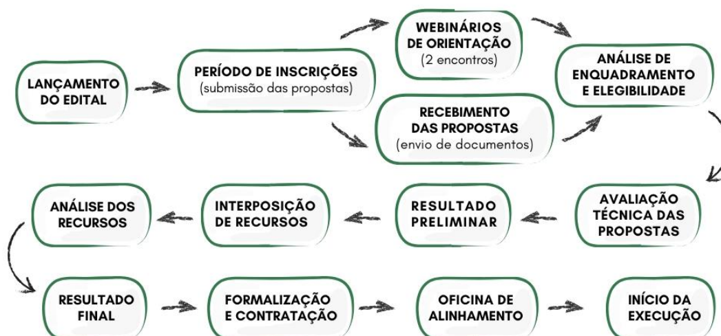
Figura 03. Fluxo do processo de seleção e execução do edital